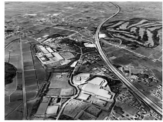
6 寄居PAスマートインターチェンジ (イメージ図)