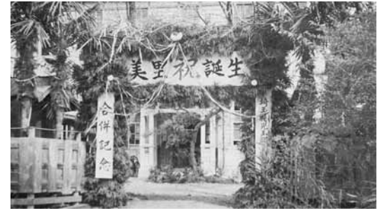
1 合併を祝ったときの役場庁舎 (昭和29年10月1日)