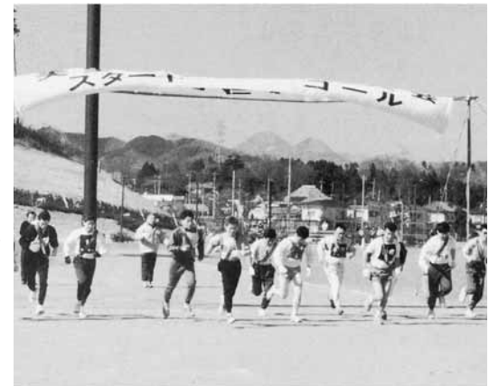
4 第1回美里町駅伝競走大会 (平成6年3月)