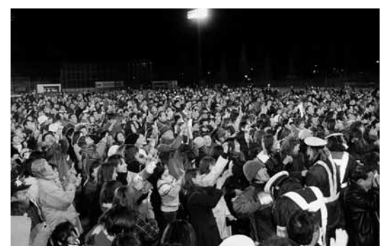
5 遺跡の森総合グラウンドで行われた21世紀幕開けイベント (平成12年12月31日)