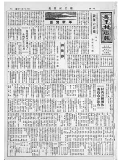
2 美里村広報第1号発行 (昭和30年1月1日) タブloid版(2ページ仕様)