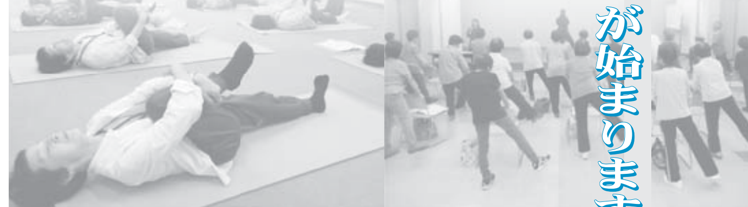
地域主体の介護予防活動を支援します

これまでの要介護認定を受けなくても、※基本チェックリストを実施することで、事業対象者として訪問型や通所型のサービスを迅速に利用できるようになります。 なお、通所リハビリテーション・福祉用具貸与・住宅改修などのサービスを受けるにはこれまでと同様に、介護認定を受ける必要