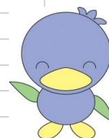
美里町マスコット ミムリン