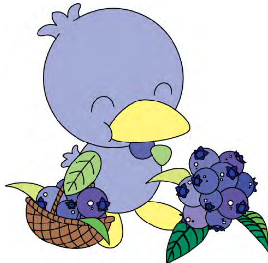
美里町のマスコット「ミムリン」