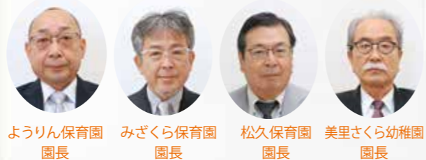
ようりん保育園 園長 みざくら保育園 園長 松久保育園 園長 美里さくら幼稚園 園長