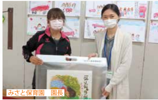
みさと保育園 園長

この事業をきっかけに、子どもたちが本に親しみ、読書を楽しむ習慣が形成されるよう、今後も読書活動の支援に努めていきます。