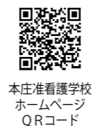
本庄看護学校ホームページQRコード