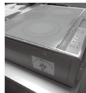
IH キッキングヒーター