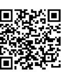
本庄准看護学校ホームページQRコード