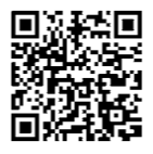
埼玉県ホームページQRコード