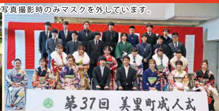
第37回 美里町成人式