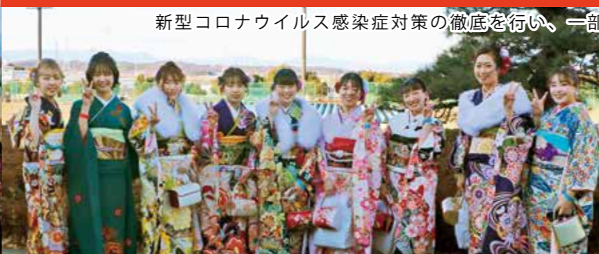
お父さんお母さん 育ててくれてありがとう