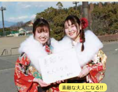
素敵な大人になる!!

新型コロナウイルス感染症対策の徹底を行い、一部写真撮影時のみマスクを外しています。