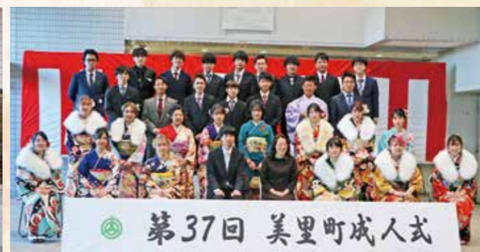
第37回 美里町成人式