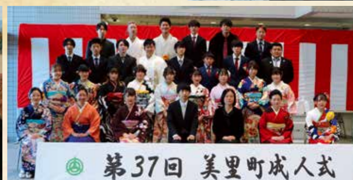
第37回 美里町成人式

ここに在る全員が、大人としての自覚を持ち、一人ひとりが自立した人間として、責任のある行動を心がけ、精神的な成長を確実に図っていきます。