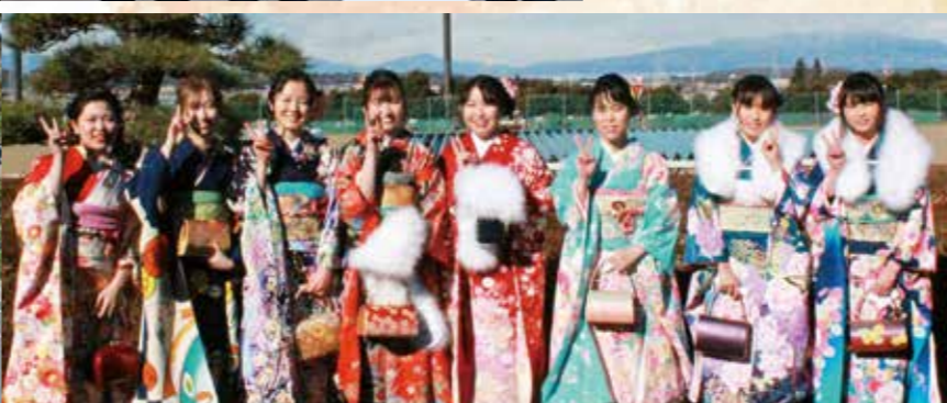
大きくなりました