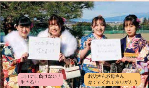
コロナに負けない! 生きる!!