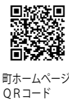
町ホームページQRコード