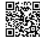
埼玉県ホームページ QRコード

虐待はいかなる理由があっても禁止されるものです。虐待を発見した、虐待を受けている、虐待をしてしまったなどの場合は、「埼玉県虐待通報ダイヤル#7171」に電話してください。(IP電話をご利用のかたなどは048-762-7533へ) 詳しくは、埼玉県ホームページをご覧ください。