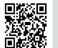
災害防災メール配信サービス専用ページQRコード