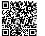
メールアドレス専用QRコード

② メール本文に書かれているURLをクリックし、サイトポリシーをお読みいただき承諾のうえ「同意する」ボタンを押してください。