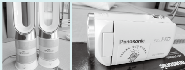
空気清浄機付ファンヒーター ビデオカメラ