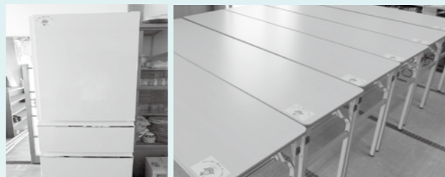
冷蔵庫 会議用テーブル

一般財団法人自治総合センターでは、宝くじの社会貢献広報事業として宝くじの受託事業収入を財源としてコミュニティ助成事業を実施しています。