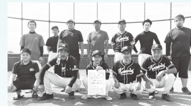
Bブロック優勝：小茂田ソフトボールクラブ

9月8日(日)、遺跡の森総合グラウンドにて、令和元年度第48回児玉郡市球技大会(ソフトボールの部)が開催され、美里町から日生工業ソフトボールクラブ、小茂田ソフトボールクラブが参加しました。