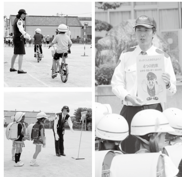
埼玉県警マスコットキャラクター「ポッポくん」とした4つの約束 ①止まる ②見る ③待つ ④確かめる

今年も、各小学校で子どもたちが外で安全に活動できるように、交通ルールについての指導が行われ、みんな真剣に学んでいました。