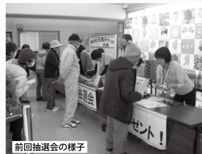
前回抽選会の様子