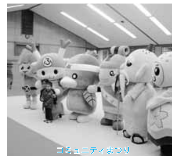
コミュニティまつり

※詳しくは、町の各施設に置いてあるチラシが、毎戸に配布されるチラシをご覧ください。