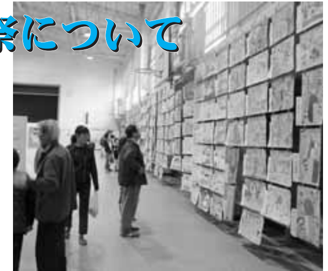
昨年の美里町民祭の様子