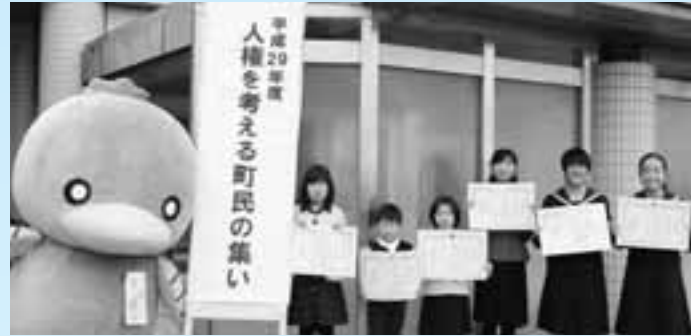
当日、人権標語・作文を発表したみなさん