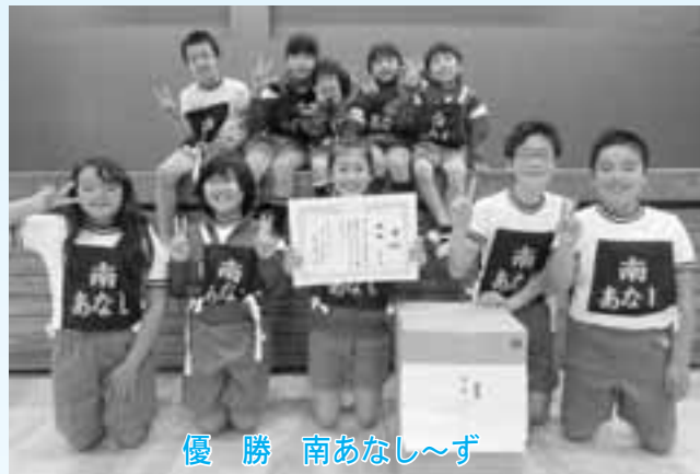
優勝 南あなし〜ず 準優勝 大仏 第3位 根木A/関レッド

11月11日、町民体育館にて第23回美子連スポーツ交流会「つなひき大会」が開催されました。