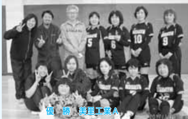
優勝 美里工業A 準優勝 ツインズ 第3位 コスモスレディース

11月6日、町民体育館で秋季バレーボール大会が開催されました。男女混合で行われるようになってから今年で5回目となります。