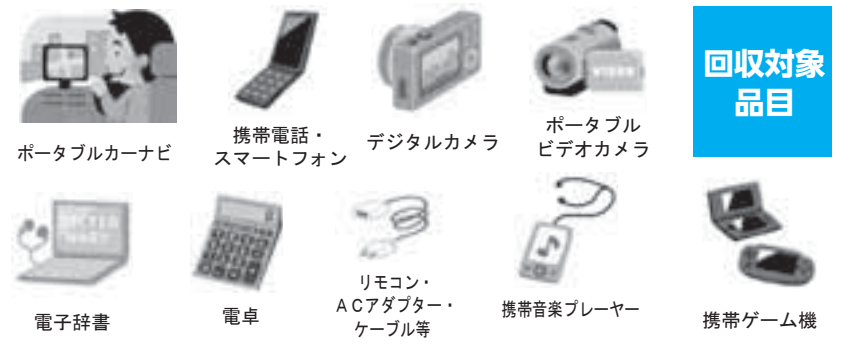
これらの電子機器は、オリンピック・パラリンピック競技大会のメダル作成に活用されます！ご協力をお願いします！！