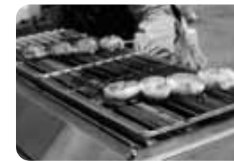
【和菓子】 菓子処たかはし