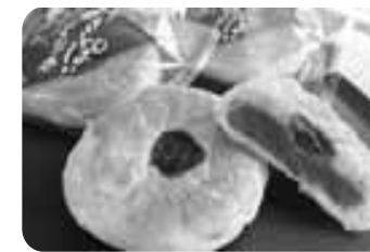
【ブルーベリー加工品】 ファームてんとむし