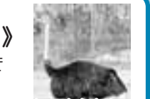
試食もできます！ この大きさ 見に来てください！