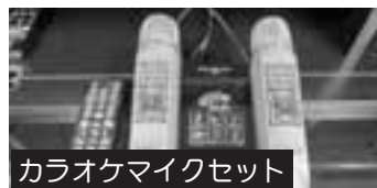
カラオケマイクセット