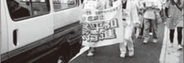
2013年原水爆禁止国民平和大行進

問 今、侵略を否定する発言や従軍慰安婦が必要なものであったなど、戦争を肯定する動きが国際問題になっております。また、人権を否定することや戦争のできる国に憲法を変えようとする策動があります。自民・