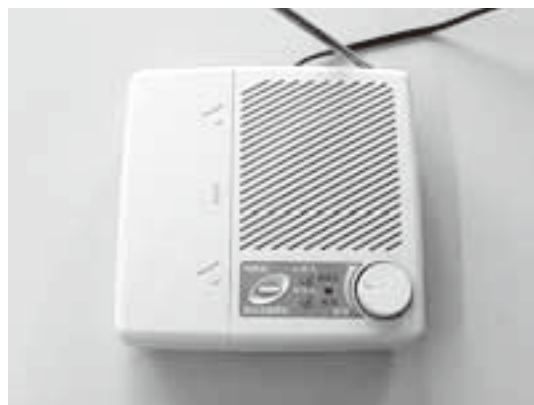
防災行政無線戸別受信機

問 行事を知らせる放送が少なくなっている。「広報みさと」は町や団体の事業を成功させるのに役立つ役割をやるのでしょうか。ほとんどの方が、我慢などをしながら町に協力しているのではないですか。知らせてもらおう権利もあり、行事を成功させることにもつながるのではないのでしょうか。