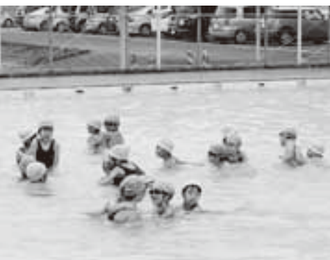
大沢小学校のプール授業

答 町長 町では申請を予定しているのは、放射線機器の費用とモニターングの費用・学校給食の食材等の