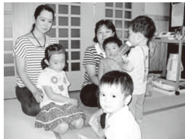
地域で育てよう 子どもたちを

答 町長 この制度を実施する上での課題といたしましては、子育ての援助提供を行なう援助会員を事前に確保しておくことが必要となりますし、援助会員の業務の困難性、提供会員の不足、援助会員が緊急に必要な対応できないなど、さまざまな問題点も挙げられています。