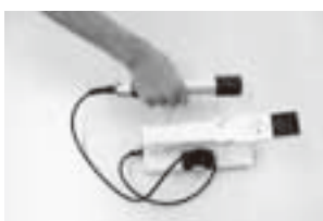
空間放射線量測定器

問 町内でも年々住宅や作業小屋など、小さきままな建物が使用されずに放置されているのが現状です。今後の有効利用の対策はあるのか、町長の見解をお聞