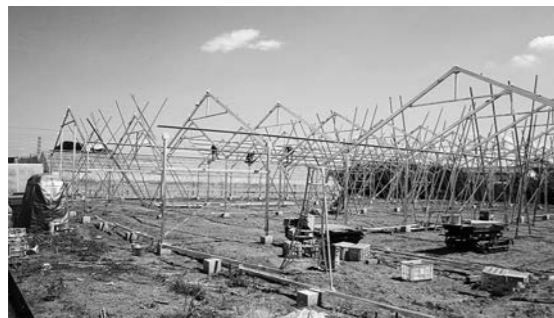
大型ハウスの復旧状況