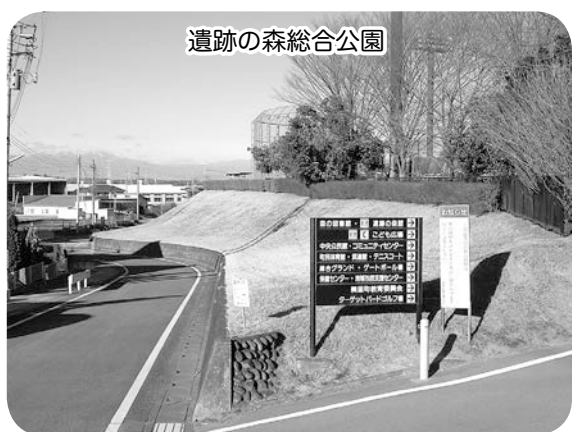
遺跡の森総合公園

そこに発表の場のない芸 術家たちの作品、例えば屋 外彫刻・レリーフ・屋外アー ト・オブジェなどをインター ネット等で募集し、芸術家 たちの管理のもと、一定期 間の展示を認めるといった 内容です。