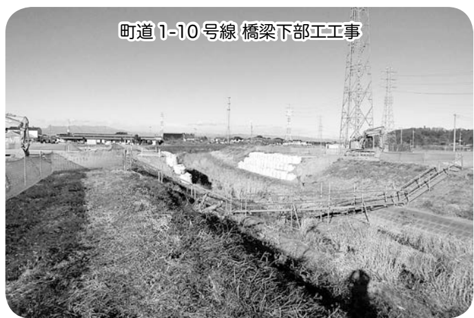
町道1-10号線 橋梁下部工工事

そこで、①寄居スマート ICのアクセス道路等の進 捗状況、課題及び周辺地域 の農村地域工業等導入促進 法(農工法)に基づく産業 団地の進捗状況と優良企業