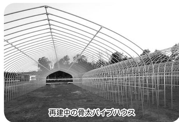
再建中の骨太パイプハウス

災害はいつ起こるかわかりません。災害によっては公共の防災関係機関による支援・救出・救護等が期待できない場合があります、この