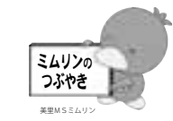
ミムリンのつばやき