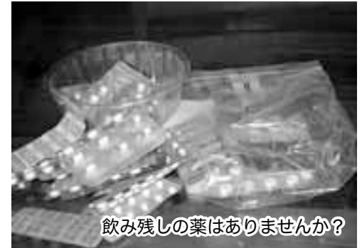
飲み残しの薬はありませんか？

答 保健師が重複受診をレポートで確認し、訪問指導を行っています。また、医療費軽減のためにジェネリック薬品の説明を同時にお知らせしています。