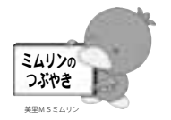
ミムリンのつばやき