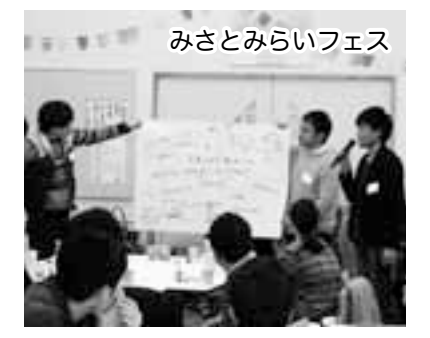
みさとみらいフェス