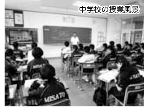
中学校の授業風景

問 保養所施設利用補助金は町民に喜ばれていますが、決算はしっかりできていますか。