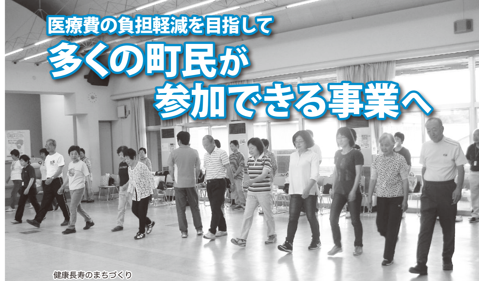
健康長寿のまちづくり