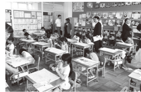
東見玉小学校の授業風景

文教民生経済常任委員会が、教育長はじめ教育委員会事務局 同席のもと、6月14日子どもたちの夢と希望がいつぱい詰まっている小中学校を訪問しました。まず初めに、東見玉小学校・松久小学校・大沢小学校、そして最後に美里中学校の順に各学 校を訪問し、校長先生から教育 目標や学校運営方針等の説明が ありました。