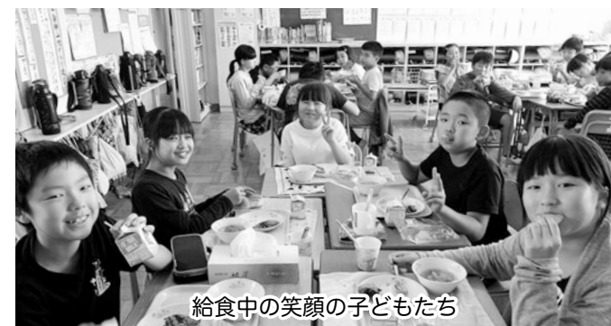
給食中の笑顔の子どもたち

教育長 学校給食衛生管理基準につきましては、子どもたちの口に入る安心安全な学校給食ですので、当然それに沿って改善していくものというふうに考えています。