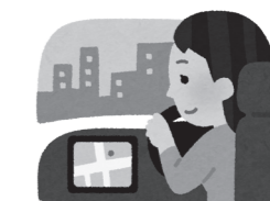
混雑ルートと時間の回避