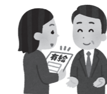
計画的な休暇の取得