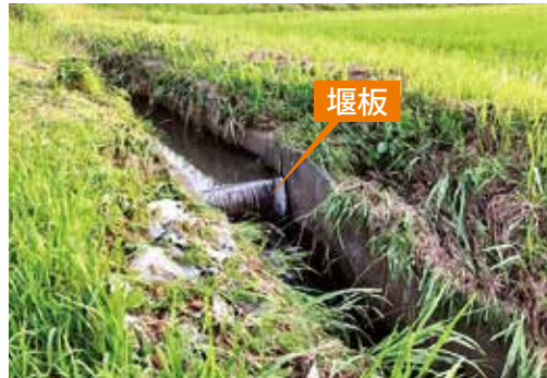
▲堰板が設置してある排水路

なお、その際には、台風や豪雨の到来前に、身の回りの安全を確保したうえで作業をお願いします。