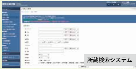
所蔵検索システム

館内で本を探す場合は、検索システムをご利用いただくと便利です。所蔵検索システムからも検索できます。お困りのときは、お気軽にご相談ください。