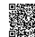
応援公式サイトQRコード