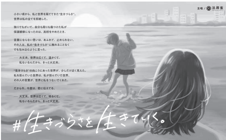
犯罪や非行を防止し、立ち直りを支える地域のチカラ 第72回 社会を明るくする運動

「愛の募金」活動へのご協力をお願いします！ 「愛の募金」とは、社会を明るくする運動の一環として、更生保護女性会が行う募金活動です。この募金は、青少年育成・子育て支援活動・更生保護施設への助成などに活用されます。 福祉課窓口で募金箱を設置しますので、ご協力をお願いします。