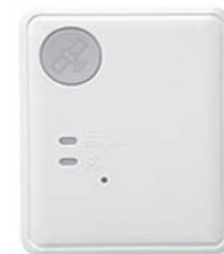
原寸大(縦47.5mm・横38.5mm・厚さ11.85mm)

また、このサービスには、日常生活賠償補償が付帯されています。これにより、サービス利用者が意図せず踏切に進入して鉄道を止めてしまうなど、法律上の損害賠償責任を負った場合の損害を補償し、ご家族の負担を軽減することができます。