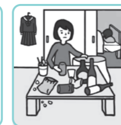
アルコール・薬物・ギャンブル問題を抱える家族に対応している