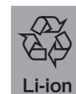
Li-ion リチウムイオン電池