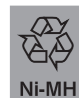
Ni-MH ニッケル水素電池