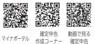
マイナポータル 確定申告作成コーナー 動画で見る確定申告

青色申告決算書・収支内訳書の作成がスマホ専用画面で可能になります！ ※下記のQRコードから、確定申告に関するさまざまな情報を取得することができます。併せて、ご利用ください。