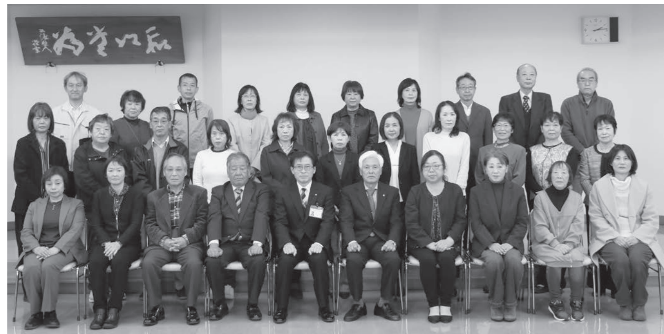
■各地区の民生委員・児童委員(敬称略) ※「-」は欠員です。

民生委員・児童委員は、福祉について住民の立場に立った相談・援助・福祉サービスの情報提供・利用などの支援活動を行っています。