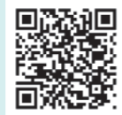
ホームページ QRコード