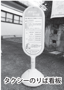
タクシ-のりば看板

決算特別委員会の中で、各議員から執行状況等に関する200件以上の質疑がありました。