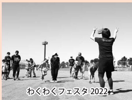
わくわくフェスタ 2022

令和5年第3回美里町議会定例会が、9月1日から22日までの22日間の日程で開催されました。この議会では、令和4年度の一般会計及び特別会計等の7会計の決算を慎重に審議し、一般会計については不認定となり、特別会計等の6会計は認定しました。 その他、令和5年度一般会計及び特別会計等の補正予算、条例の一部改正等が可決しました。 また、議員4名による一般質問が行われました。