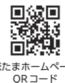
恋たまホームページ QRコード