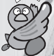
埼玉県マスコット「コバタン」

不正軽油の製造・運搬・販売・使用は「犯罪」です。 「不審なタンクローリーが頻繁に出入りしている！」 「異常に安価な軽油の売り込みを受けた！」 「黒煙など通常とは異なる排気ガスを出して走行していた！」 など、不正軽油についての情報をお寄せください。