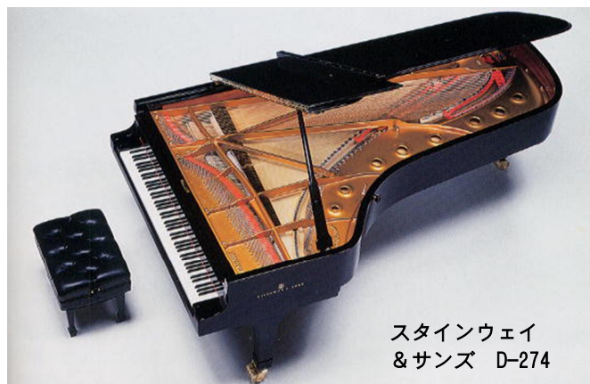
スタインウェイ & サンズ D-274

遺跡の森館ホールで最高のピアノを 思う存分に弾いてみませんか？ 町民以外の方も申込出来ますので お気軽に申し込みください。