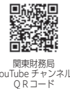
関東財務局 YouTubeチャンネル QRコード