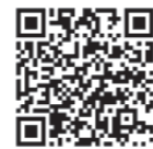
町ホームページ QRコード

1. 申請書兼請求書、5. 在職証明書、6. 個人情報確認同意書は、町ホームページからダウンロードできます。