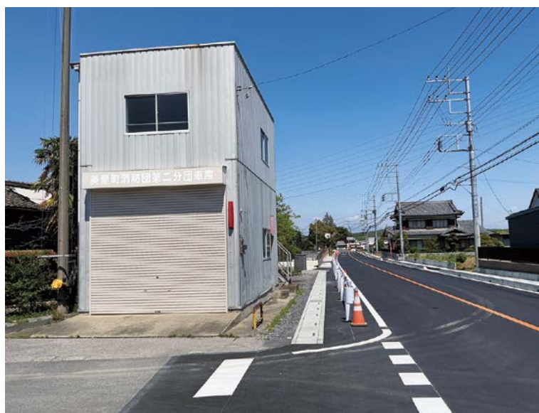
旧第2分団車庫・詰所