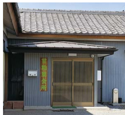
助成金を予定していた甘粕地区