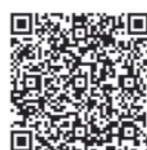
美里町公式LINEアカウント QRコード

美里町公式LINEアカウントから、給付金に関する質問と回答が確認できます。ぜひ、ご利用ください。