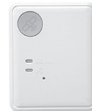
端末機実物 (縦47.5mm・横38.5mm・厚さ11.85mm)

また、このサービスには、日常生活賠償保険が付帯されており、サービス利用者が意図せず踏切に進入して鉄道を止めてしまうなど、法律上の損害賠償責任を負った場合の損害を補償し、ご家族の負担を軽減することができます。