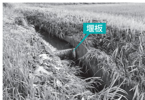
▲堰板が設置してある排水路

なお、その際は、台風や豪雨の到来前に、身の回りの安全を確保したうえで作業をお願いします。